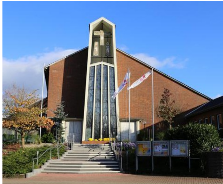
katholische Kirche St. Bernward Ilsede